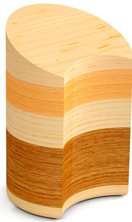
Tamaño 2,9 l.