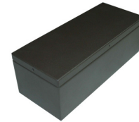
Urna de dimensiones: 280x110x120 mm.

Ejemplo módulo de 10 filas x 10 columnas: 100 urnas Volumen de la urna: 3,6 litros.